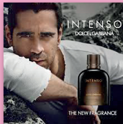
Grupo de imágenes n°1

Sin embargo, no hay una sola manera de ser hombres. La masculinidad puede encontrar diversas formas de expresión que no necesariamente se corresponden con este estereotipo.