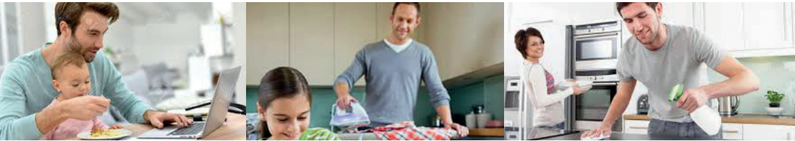
Grupo de imágenes n°2

Estas masculinidades distintas, no predominantes, han estado siempre presentes. Muchas veces silenciadas, ocultadas, desvalorizadas y hasta rechazadas. Pero existen, y empiezan a tomar cuerpo y voz a partir de la interpelación que el feminismo hace a los estereotipos de género. También a partir de estos aportes se posibilita la deconstrucción crítica de este modelo patriarcal del ser varón abriendo el abanico de posibilidades y de expresiones.